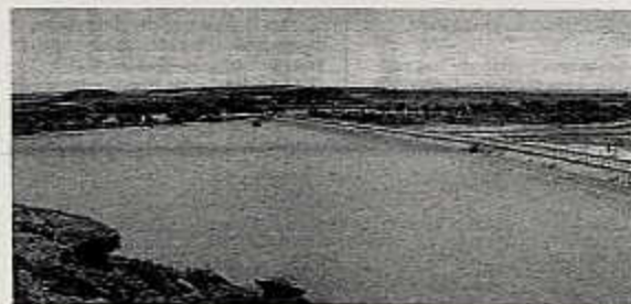
Balsa del río Flumen en Los Monegros.

lógica como es el caso de la Laguna de Sarriena, cuyo caudal está regulado, frente a otros que a pesar de haber caído en desuso son "un claro ejemplo del ingenio y tesón de los monegros en su empeño de aprovechar al máximo sus escasos recursos hídricos". En un primer paso, el Insti-